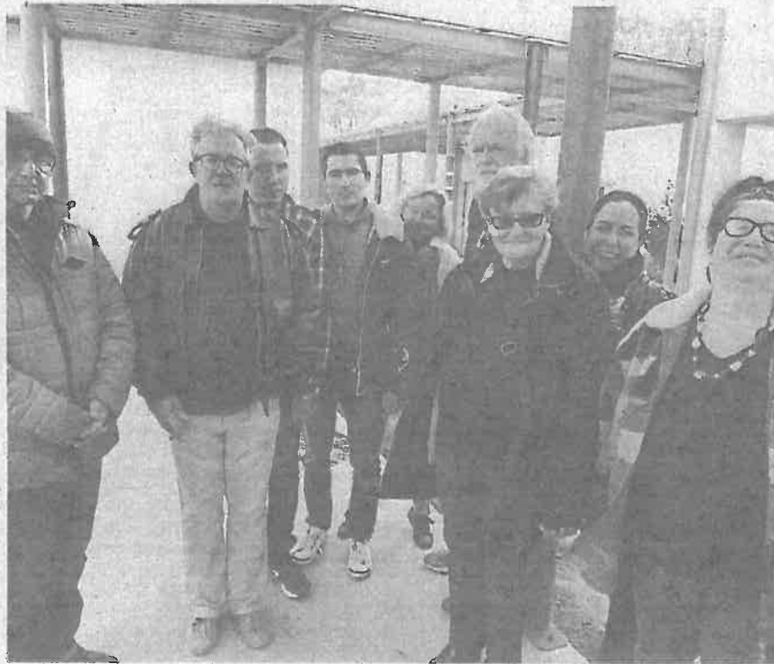
L'équipe de « Partenaires particulier » de FAM de Montflourès.